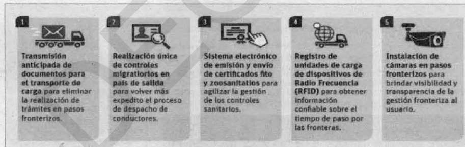
Medidas para la estrategia de facilitación comercial y competitividad.

Entre los impactos que el BID prevé está el crecimiento del comercio regional, la creación de 710 mil nuevos puestos de trabajo y la reducción del 6.6 por ciento en el costo de las importaciones.