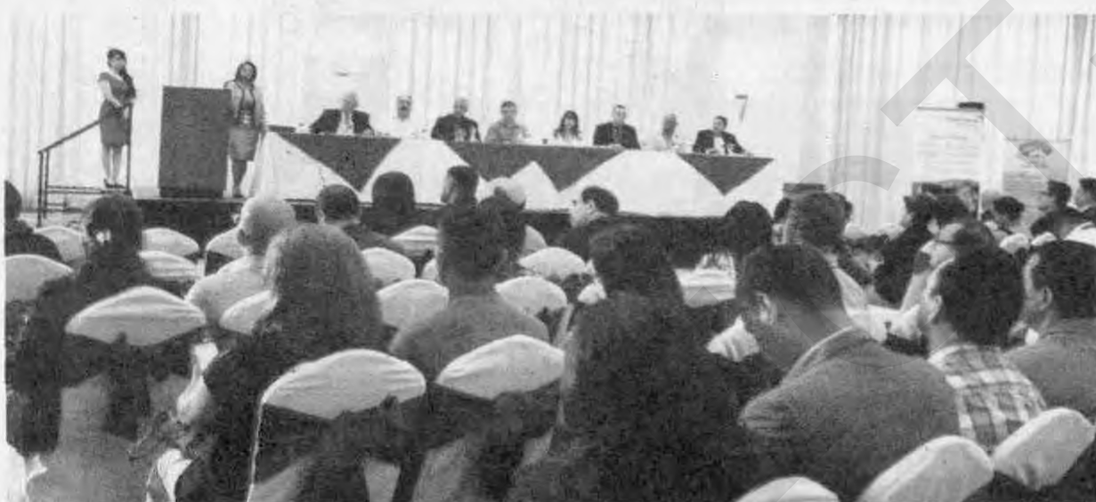
Los representantes de unas nueve organizaciones publicaron los logros obtenidos, mejorando la calidad de vida de los pobladores en extrema pobreza.

Más de 34 mil familias fueron beneficiadas con viviendas, huertos, acueductos, entre otras ayudas, ejecutadas por ONGD certificadas por el Programa "Vida Mejor"