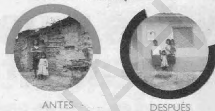
Familias que vivían en casuchas de adobe, recibieron inmuebles dignos y seguros.