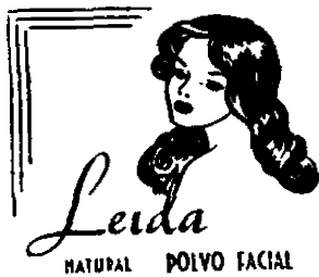
figura de una mujer; y la cual se aplica a los envases, cajas y empaques que contienen los productos, grabándola, imprimiéndola, estampándola, por medio de etiquetas que se les adhieren, y en cualquiera otra