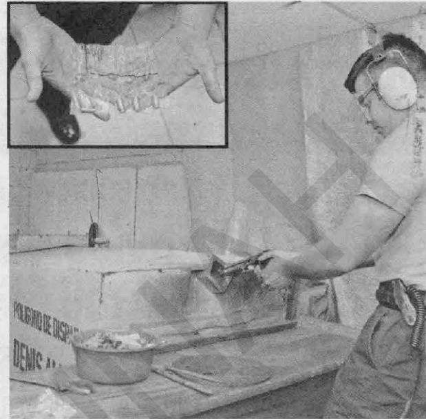
Las armas que se registran o se decomisan son sometidas a pruebas de balística, además que el propietario debe llevar no menos de cuatro balas completas con cartuchos y proyectiles (foto inserta).