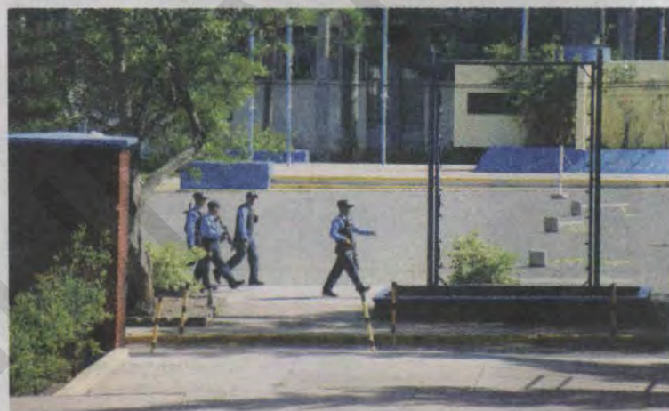
El viernes pasado fueron desalojados por la Policía.

Durante el desalojo de los "Encapuchados", quienes alegan violencia por