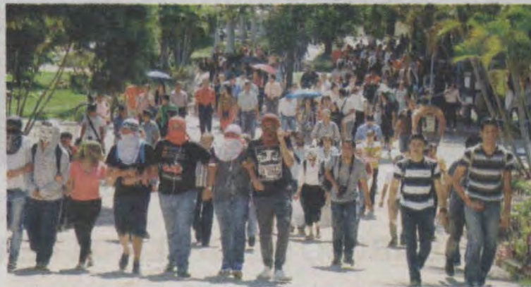
MEU quiere que inicien el 26 de septiembre, cuando ya no esté la