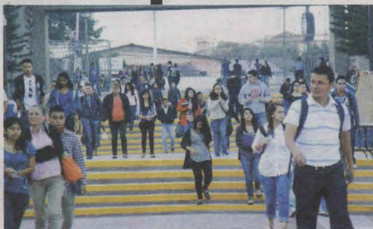
Hoy a las 6:00 am la UNAH reinicia segundo período académico.

En cuanto a la UNAH-TEC Aguán, UNAH-TEC Danlí, El Centro Universi-