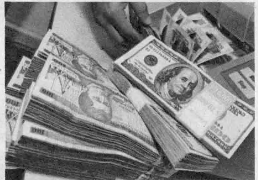
Datos regionales ubican a la banca hondureña con una expansión en los niveles de rentabilidad del 15 al 17 por ciento a mayo de este año.

Al restar la inflación a los índices promedio de expansión, a la banca le queda un crecimiento real del 6.83 por ciento que se reflejan en un crecimiento de "11.46 por ciento" de un