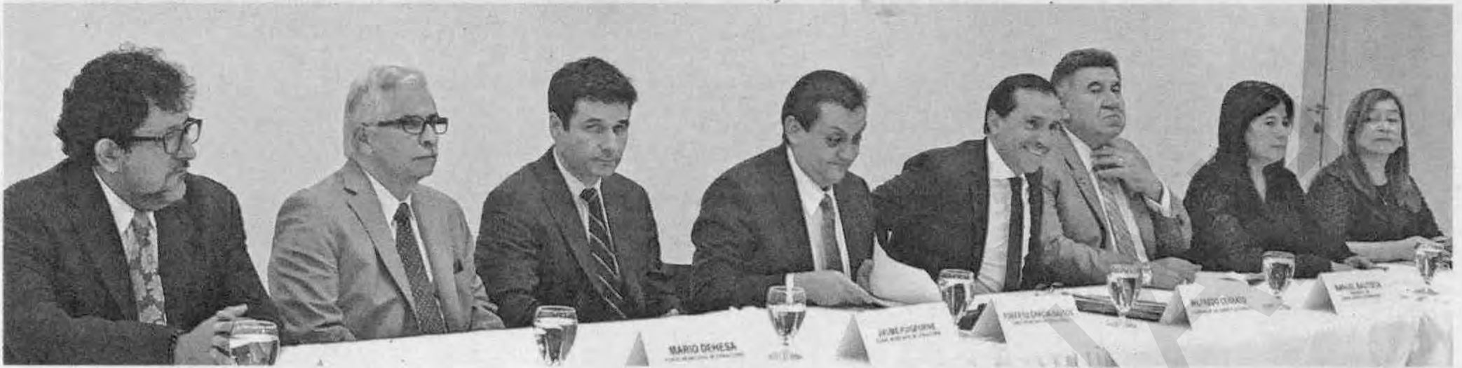
La estabilidad macroeconómica tiene su génesis en el cumplimiento del acuerdo Stand By con el FMI y el "paquetazo fiscal" del 2014.