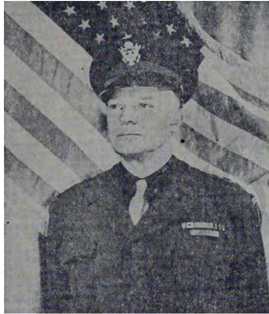
Nueva fotografía del General Dwight D. Eisenhower, Comandante Supremo de las Fuerzas Expedicionarias Aliadas que se preparan para la liberación de la Europa sojuzgada.

grandiosas, fechas que sea una fecha que no olvidarán las generaciones como el 4 de Julio de presentes y porvenir, 1776 y 14 de Julio de 1789, han hecho época en sus anales, tanto por que sus anales, tanto por que han marcado el fin de un trato inhumano para el hombre, como el advenimiento de prácticas y principios acordes con su naturaleza de hombre, pero ninguna de estas fechas tiene su significado y marca a la perfección, el principio del fin de una época verdaderamente menguada para los pueblos que en mala hora cayeron víctimas de un despotismo y crueldad jamás vistos por el género humano, ni glosando los días nefastos de Atila y los demás bárbaros que cayeron como bestias sobre la civilización antigua.