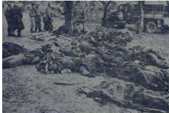
Soldados del cuerpo médico de los Estados Unidos, que se ven al fondo, se preparan a disponer de los cadáveres de soldados nazis recogidos en un campo de batalla de Italia. Foto transmitida a Washington por radio desde Argelia.

Por otra parte, es urgente eleccionar un tanto a nuestros agricultores, que continúan produciendo con el empirismo y la rutina de nuestros abuelos; finalidad que no es fácil, pues cuando nuestros campesinos saben leer, no acostumbren ver un impreso, fracasando así el procedimiento que para mejorar las técnicas agrícolas e industriales lo mismo que el veneno pecuario, propone José Ceollio del Valle, consistente en que se difundieren impresos dando a conocer los métodos de pueblos mejor preparados que los nuestros entre nuestras clases trabajadoras.