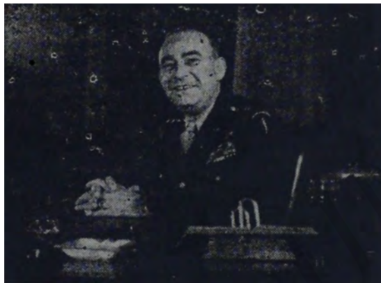
En Fráncfurt, Alemania, el General Joseph T. McNarney toma posesión de su cargo como comandante de las fuerzas de los Estados Unidos en Europa. Substituye al General Dwight D. Eisenhower, quien es ahora el jefe del Estado Mayor del Ejército Estadounidense.

Interpretaciones antojadizas y por lo tanto alejadas de las más elementales reglas de la hermenéutica jurídica se han dado por la oposición con ocasión de tal Decreto Legislativo. Se cree que con el levantamiento del estado de sitio se abren las puertas al libertinaje; se supone que volveremos a contemplar el panorama sombrío y macabro de la guerra intestina por motivos de que no se pondrán cortapisas a las intenciones malsanas y antipatrióticas y se sueña también que ya se podrá ir desde ahora inyectando el virus letal de la politiquería oriunda iniciándose la campaña electoral de Autoridades Supremas que se avvicinar: